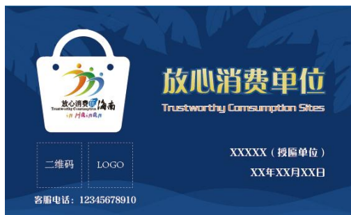
图3：放心消费单位牌匾

D.4.4 放心消费单位牌匾由已获授权的放心消费单位通过评价机构备案后制作也可委托评价机构制作，并将放心消费单位牌匾悬挂在便于消费监督、方便消费指引的醒目位置，“放心消费单位”牌匾样式如下：